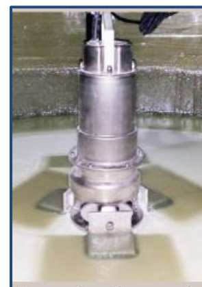
Pompe inox immergée