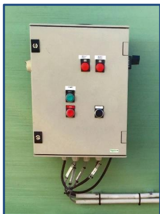
Coffret de commande électrique avec voyant de contrôle