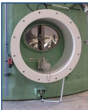
Double porte étanche permettant l'accès à la pompe