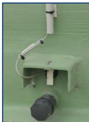
Détecteur de fuites